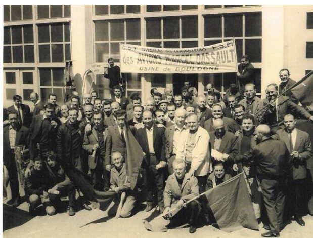
Mai 68 chez Dassault Boulogne

Vous vous en doutez bien, l'usine du Vieux Pont de Sèvres n'est pas en reste sur les autres usines Dassault, en cette période de bouleversement social. La photo ci-après parle d'elle-même sauf que l'argentique noir et blanc de l'époque ne met pas en évidence tous les drapeaux rouges déployés devant l'usine Dassault occupée.