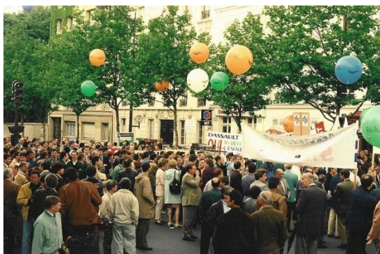
1996 : manifestation aux abords du ministère de la Défense pour défendre le Rafale. La plupart des usines sont représentées.

En dépit de ces incroyables attermoissements, nous maintenons le cap. Pourquoi une telle détermination de notre part ? Parce que notre conviction repose sur une analyse du problème de la Défense nationale française. Point par point nous réfutons les affirmations adverses.