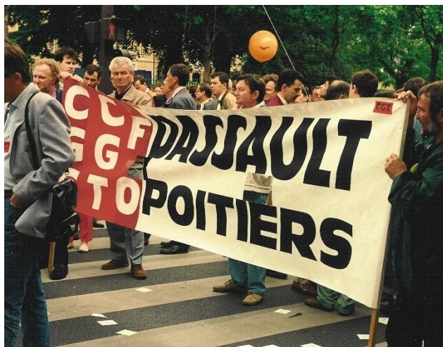
1996 : mobilisation générale pour défendre le Rafale

prouve, on ne fait pas d'économie dans ce type de coopération. De surcroît, l'avion qui en résulte est hybride et ne répond pas vraiment aux besoins des différents partenaires. Bref, la coopération militaire est le bon moyen de perdre sur tous les tableaux.